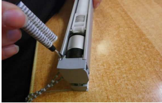
↑ 1. Benyt en lille skruetrækker til forsigtigt at fjerne endekappen.