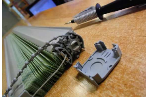
↑ 2. Tag kæden ud.