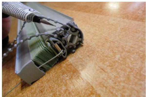
↑ 6. Påsæt endekappen.