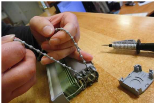
↑ 3. Indsæt den nye kæde og træk kort i begge retninger.