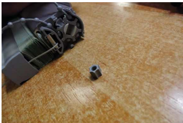
↑ 5. Sæt tandhjulet på igen.